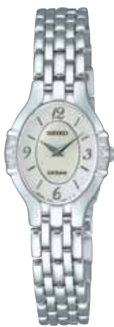
SWDB057 78,750円 (税抜き75,000円) パラジウムめっきケース(ダイヤ入り) 白蝶貝ダイヤル