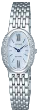
SWDX103 105,000円 (税抜き100,000円) パラジウムめっきケース(ダイヤ入り) 白蝶貝ダイヤル