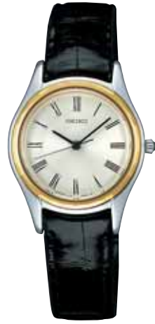
SWDL175 178,500円 (税抜き170,000円)