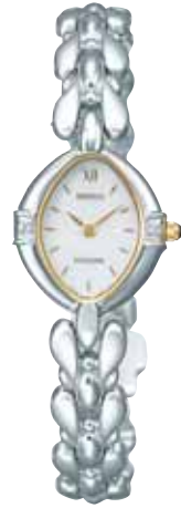
SWDX095 47,250円 (税抜き 45,000円)