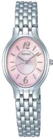
SWDF053 52,500円 (税抜き 50,000円)