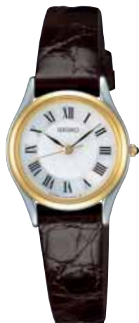
SWDL162 57,750円 (税抜き 55,000円) ステンレスケース(一部金色めっき) 白蝶貝ダイヤル