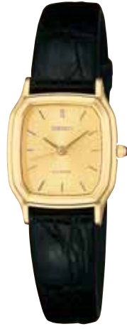
SWDH074 73,500円 (税抜き 70,000円) 厚金色めっきケース