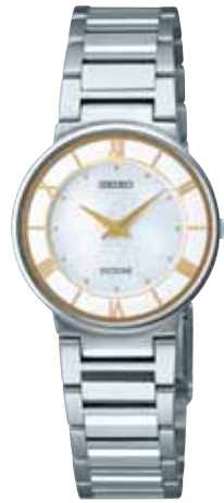
SWDL149 63,000円 (税抜き 60,000円) ステンレスケース 白蝶貝ダイヤル

〈共通仕様〉 ●サファイアガラス(無反射コーティング) ●日常生活用防水 ●耐磁 ●ワンプッシュ中留 ●電池寿命:約2年 ●精度:年差±10秒