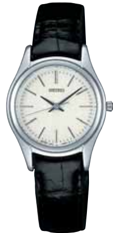
SWDL171 157,500円 (税抜き150,000円)