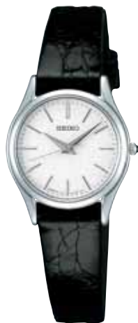
SWDL161 52,500円 (税抜き 50,000円) プラチナめっきケース

〈共通仕様〉 ●裏ふたステンレス ●サファイアガラス(無反射コーティング) ●日常生活用防水 ●耐磁 ●電池寿命:紳士用約3年、婦人用約2年 ●精度:年差±10秒