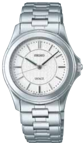
SACM139 89,250円 (税抜き 85,000円) ステンレスケース (ダイヤシールド)