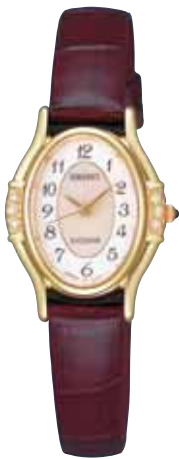
SWDB042 68,250円 (税抜き 65,000円)