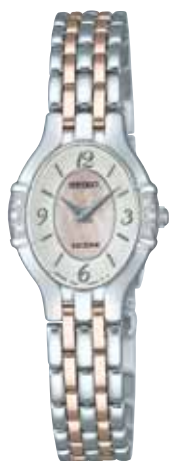
SWDB056 78,750円 (税抜き75,000円) パラジウムめっきケース(ダイヤ入り) 白蝶貝ダイヤル