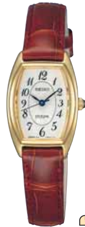
SWDB062 52,500円 (税抜き 50,000円)