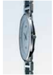
ドレスシーな薄型フォルム