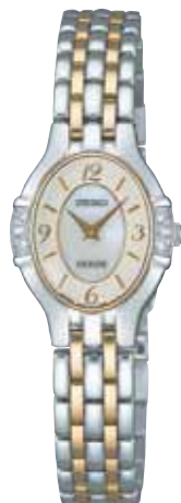
SWDB071 78,750円 (税抜き75,000円) パラジウムめっきケース(ダイヤ入り) 白蝶貝ダイヤル

(P13・P14共通仕様) ●裏ぶたステンレス ●カーブサファイアガラス(無反射コーティング) ●日常生活用防水 ●耐磁 ●ワンタッチ中留 ●電池寿命:約3年 ●精度:平均月差±15秒