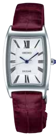
SWDL159 73,500円 (税抜き 70,000円) ステンレスケース

〈共通仕様〉 ●カーブサファイアガラス(無反射コーティング) ●日常生活用強化防水(10気圧) ●耐磁 ●ワンプッシュ中留 ●電池寿命:紳士用約3年、婦人用約2年 ●精度:年差±10秒