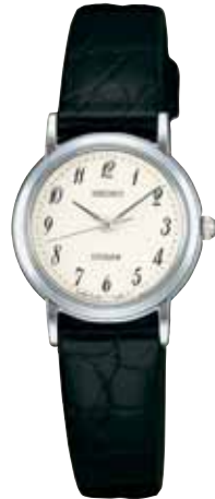
SWDL061 63,000円 (税抜き 60,000円) プラチナめっきケース

〈共通仕様〉 ●裏ふたステンレス ●カーブサファイアガラス〈SADV044、SWDH074はサファイアガラス〉 ●日常生活用防水 ●耐磁 ●電池寿命・紳士用約3年、婦人用約2年 ●精度:年差±10秒〈SWDH074は年差±20秒〉