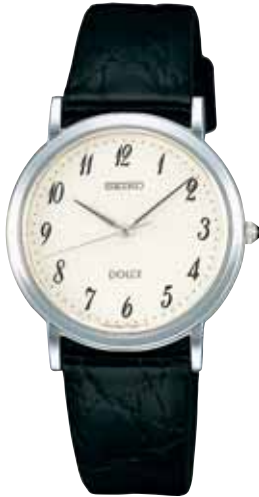
SADV061 63,000円 (税抜き 60,000円) プラチナめっきケース