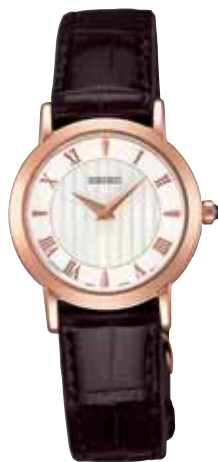
SWDL180 94,500円 (税抜き 90,000円) ピンクゴールド色めっきケース

〈P1・P2 共通仕様〉 ●カーブサファイアガラス(無反射コーティング) ●日常生活用防水 ●耐磁 ●ワンプッシュ中留 ●電池寿命:約2年 ●精度:年差±10秒