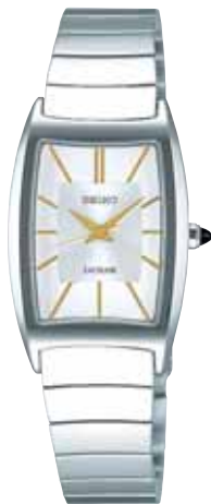
SWDL157 73,500円 (税抜き 70,000円) ステンレスケース