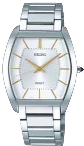
SACM147 73,500円 (税抜き 70,000円) ステンレスケース