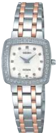
SWDX119 189,000円 (税抜き180,000円) ステンレスケース(ダイヤ入り) ダイヤ入りダイヤル ダイヤ入りめうず