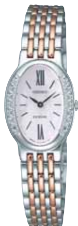
SWDX105 105,000円 (税抜き100,000円) パラジウムめっきケース(ダイヤ入り) 白蝶貝ダイヤル