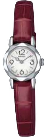
SWDZ047 94,500円 (税抜き 90,000円) ステンレスケース