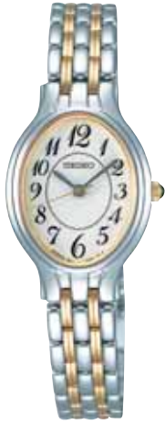
SWDF052 52,500円 (税抜き 50,000円)