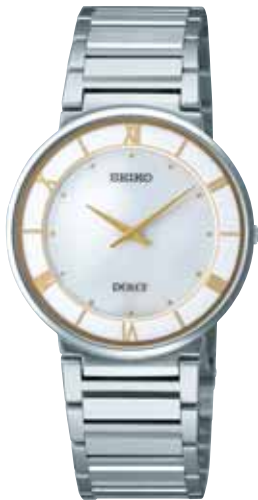
SACK017 63,000円 (税抜き 60,000円) ステンレスケース 白蝶貝ダイヤル