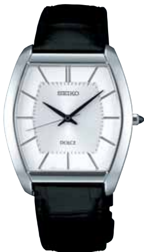
SACM149 73,500円 (税抜き 70,000円) ステンレスケース