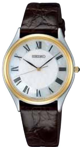
SACM152 57,750円 (税抜き 55,000円) ステンレスケース(一部金色めっき) 白蝶貝ダイヤル