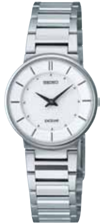
SWDL147 63,000円 (税抜き 60,000円) ステンレスケース