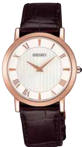
SACK030 94,500円 (税抜き 90,000円) ピンクゴールド色めっきケース