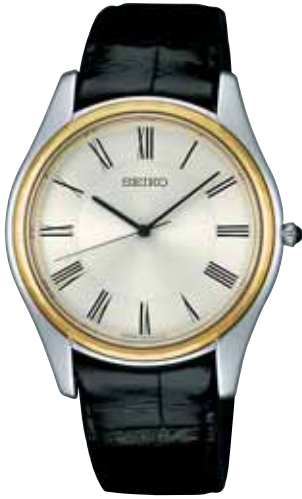
SAAK005 189,000円 (税抜き180,000円)