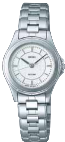
SWDL139 89,250円 (税抜き 85,000円) ステンレスケース (ダイヤシールド)

〈共通仕様〉 ●サファイアガラス(無反射コーティング) ●日常生活用強化防水(10気圧) ●耐磁 ●ワンプッシュ中留 ●電池寿命:紳士用約3年、婦人用約2年 ●精度:年差±10秒