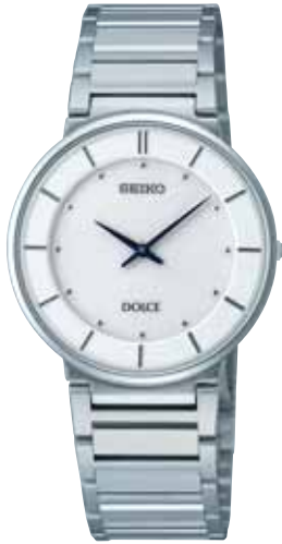
SACK015 63,000円 (税抜き 60,000円) ステンレスケース