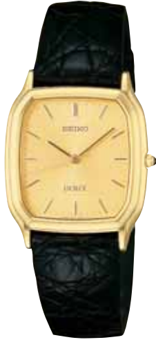
SADV044 73,500円 (税抜き 70,000円) 厚金色めっきケース