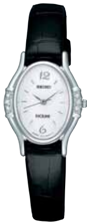
SWDB043 68,250円 (税抜き 65,000円)