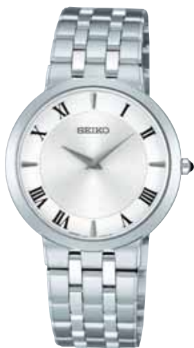
SACK031 105,000円 (税抜き 100,000円) ステンレスケース(ダイヤシールド)