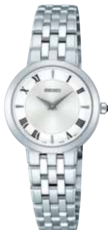
SWDL181 105,000円 (税抜き 100,000円) ステンレスケース(ダイヤシールド)