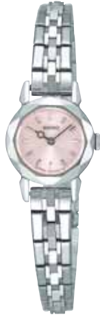
SWDZ043 94,500円 (税抜き 90,000円) ステンレスケース