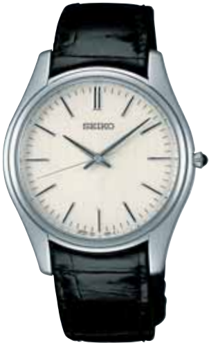
SAAK001 157,500円 (税抜き150,000円)

美しさを追求した薄型フォルム。 りゆうずに埋め込んだオニキスも 美しいアクセントに。