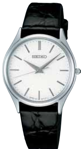
SACM151 52,500円 (税抜き 50,000円) プラチナめっきケース