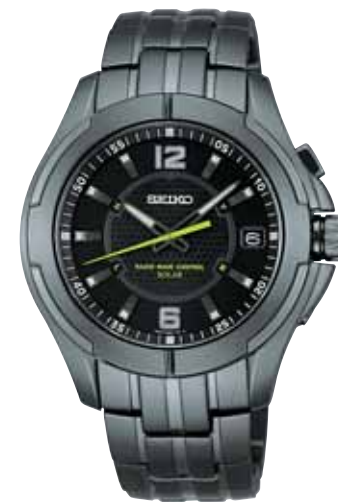
NEW 6月発売 SBTM039