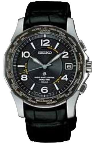
SAGZ011 115,500円(税抜き 110,000円) Cal.7B25