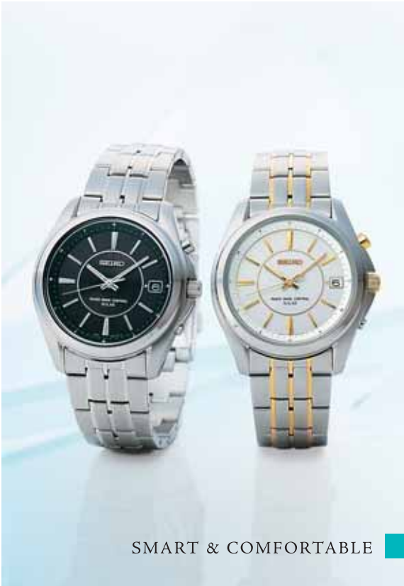
SMART & COMFORTABLE