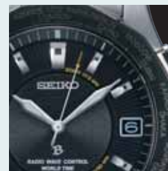
ワールドタイム機能

ベゼル部に配置されたタイムゾーンを針で選択することで、海外の現地時刻に合わせるすることができます。さらに、受信範囲内では、電波を受信して正確な現地時刻に合わせるすることができます。