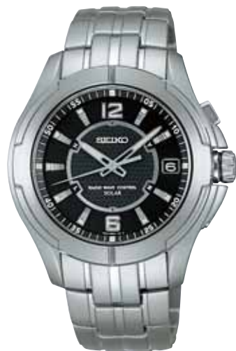
NEW 6月発売 SBTM033