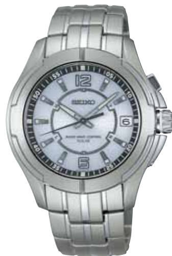
NEW 6月発売 SBTM035