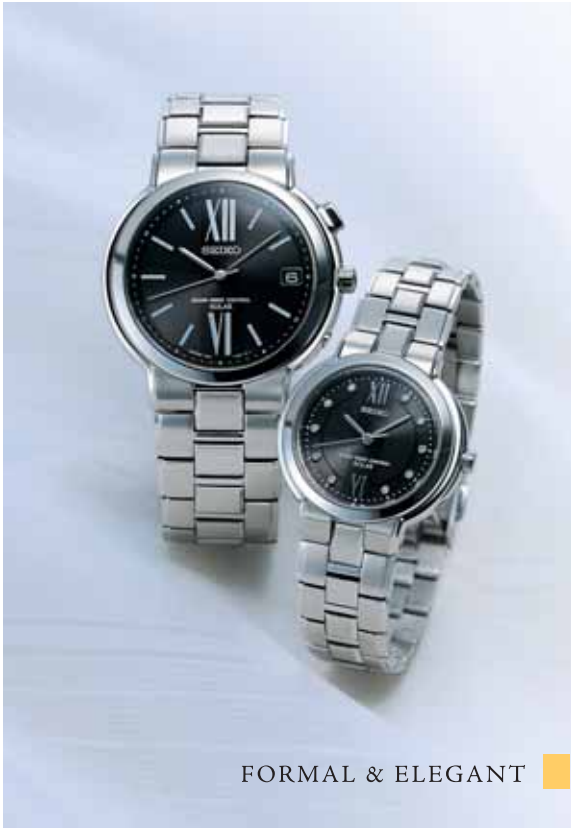
FORMAL & ELEGANT