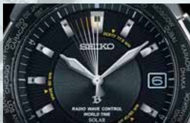
針位置自動修正機能

一定時間毎に針位置をチェックし、強い衝撃や磁気の影響などにより方が一ずれている場合は、自動的に正しい位置に修正します。秒針は1分毎、時・分針は12時間毎に針位置チェックを行います。