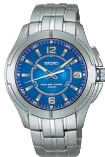
NEW 6月発売 SBTM037