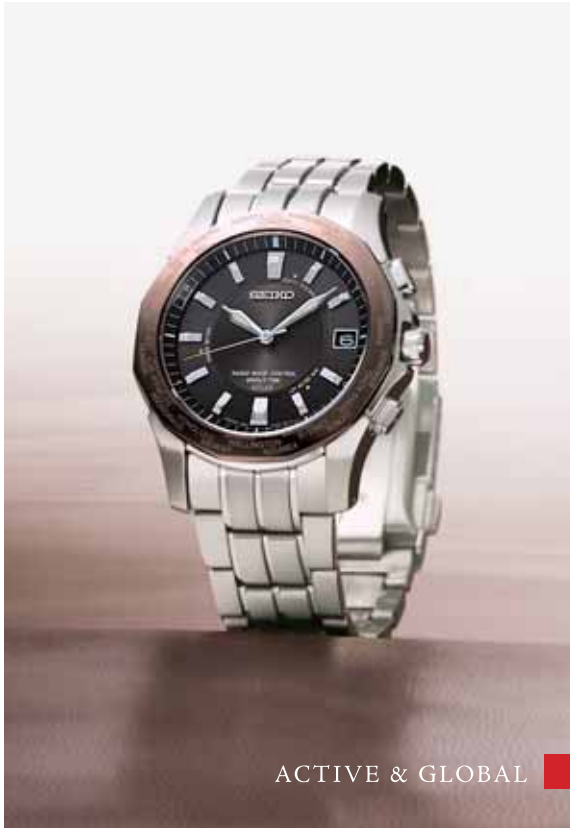
ACTIVE & GLOBAL