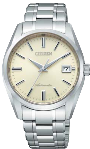
NA0000-59B オールドシルバー

ステンレスケース&バンド 三ツ折れプッシュタイプ中留 サファイアガラス (両面無反射コーティング) デュラテクト 10気圧防水 27石 持続時間約42時間(最大巻き上げ時) 平均日差-5~+10秒* 振動数 28,800回