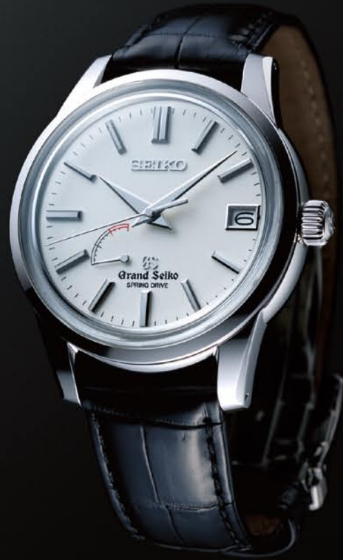
自動巻(手巻つき) スプリングドライブ

SBGA057 機種9R65 525,000円(税抜き 500,000円) ステンレスケース クロコダイルバンド