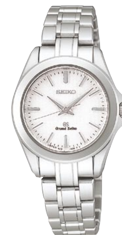
STGF043 機種4J51 189,000円(税抜き 180,000円) ステンレスケース・バンド