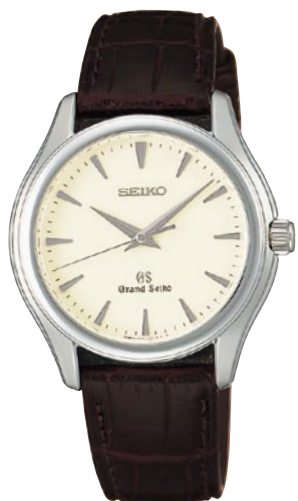
SBGX009 機種9F61 189,000円(税抜き 180,000円) ステンレスケース クロコダイルバンド