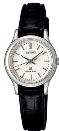
STGF029 機種4J51 189,000円(税抜き 180,000円) ステンレスケース クロコダイルバンド