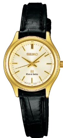
STGF038 機種4J51 504,000円(税抜き 480,000円) 18Kイエローゴールドケース クロコダイルバンド 18Kイエローゴールドリゅうず・美錠

共通仕様 クォーツモデル 日常生活用強化防水(10気圧)(SBGX038・STGF038は日常生活用防水) 耐磁 デュアルカーブサファイアガラス(無反射コーティング)(SBGX019はサファイアガラス(無反射コーティング)) 電池寿命約3年 精度:年差±10秒 SBGX018 ケースサイズ:35.5mm 重さ:166g 厚さ:11.3mm SBGX019 ケースサイズ:35.7mm 重さ:172g 厚さ:9.9mm SBGX038 ケースサイズ:35.5mm 重さ:67g 厚さ:10.0mm STGF038 ケースサイズ:26.4mm 重さ:32g 厚さ:7.6mm SBGX019は、18Kホワイトゴールドの素材の上に、より美しい銀色に仕上げるためにロジウムめっきを施しています。