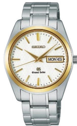
SBGT038 機種9F83 346,500円(税抜き 330,000円) ステンレスケース・バンド (一部18Kイエローゴールド)