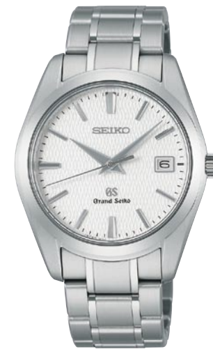
SBGX067 機種9F62 315,000円(税抜き 300,000円) ブライトチタンケース・バンド