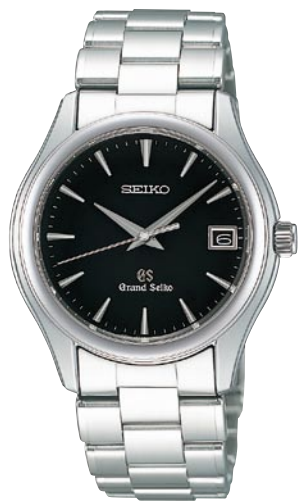
SBGX041 機種9F62 252,000円(税抜き 240,000円) ステンレスケース・バンド