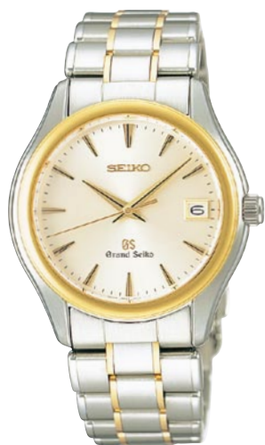
SBGX002 機種9F62 525,000円(税抜き 500,000円) ステンレスケース・バンド (一部18Kイエローゴールド)