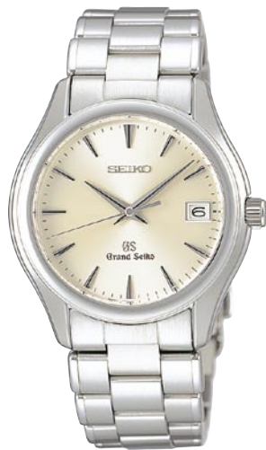
SBGX005 機種9F62 252,000円(税抜き 240,000円) ステンレスケース・バンド