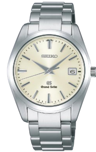
SBGX063 機種9F62 210,000円(税抜き 200,000円) ステンレスケース・バンド