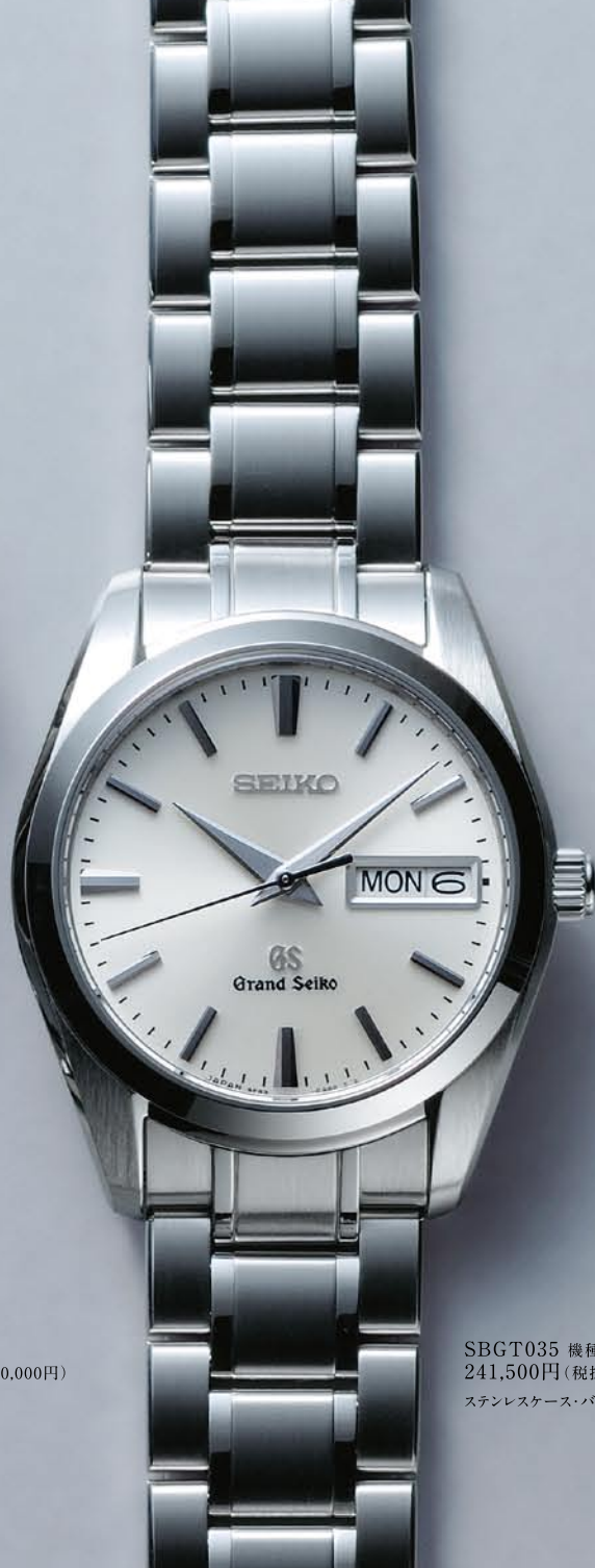
SBGT035 機種9F83 241,500円(税抜き 230,000円) ステンレスケース・バンド