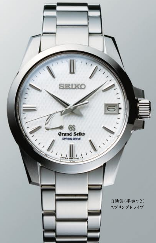
自動巻(手巻つき) スプリングドライブ

SBGE013 機種9R66 577,500円(税抜き 550,000円) ステンレスケース・バンド 24時針つき(GMT*表示可能)