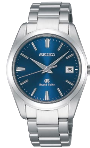
SBGX065 機種9F62 210,000円(税抜き 200,000円) ステンレスケース・バンド