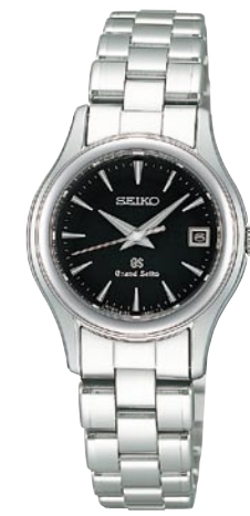
STGF041 機種4J52 252,000円(税抜き 240,000円) ステンレスケース・バンド