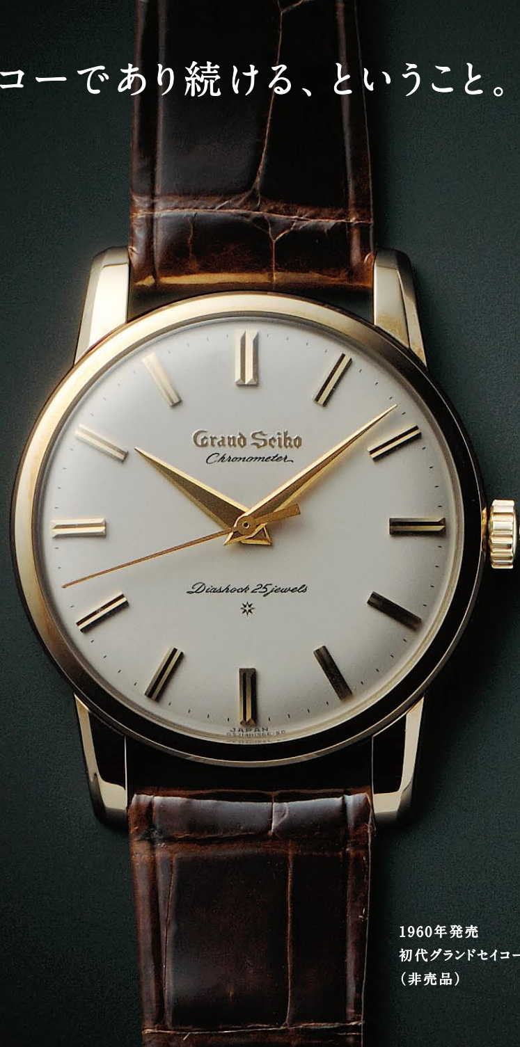
1960年発売 初代グランドセイコー (非売品)

19世紀が終わるころ、日本では明治の時代に セイコーは懐中時計の製造を開始した。そして20世紀に入ってまもなく、 国産初の腕時計の開発に取り組み、それに成功した。