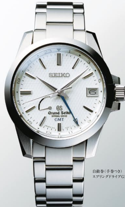
自動巻(手巻つき) スプリングドライブGMT