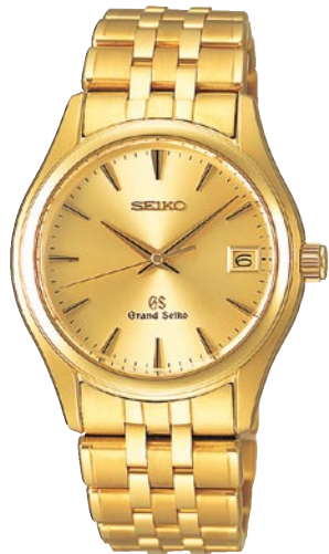
SBGX018 機種9F62 2,520,000円(税抜き 2,400,000円) 18Kイエローゴールドケース 18Kイエローゴールドリゅうず・バンド