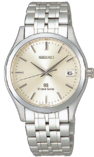
SBGX019 機種9F62 2,625,000円(税抜き 2,500,000円) 18Kホワイトゴールドケース 18Kホワイトゴールドリゅうず・バンド