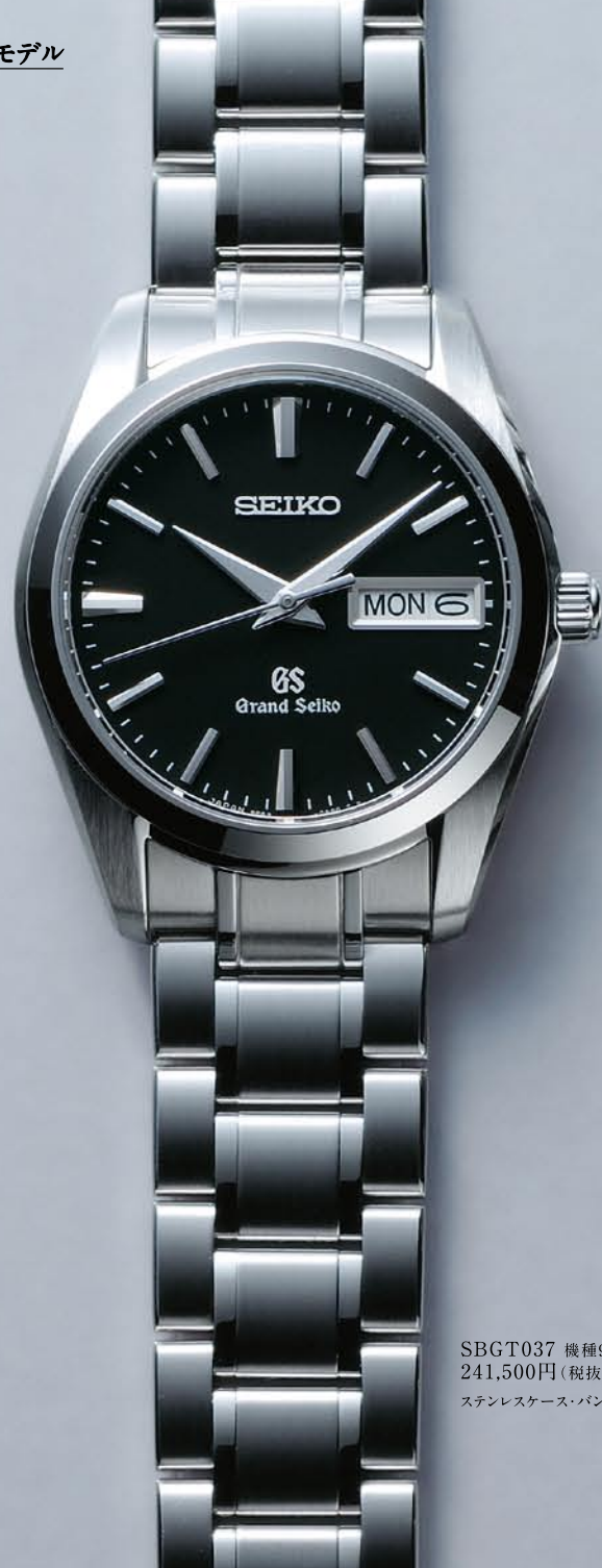
SBGT037 機種9F83 241,500円(税抜き 230,000円) ステンレスケース・バンド