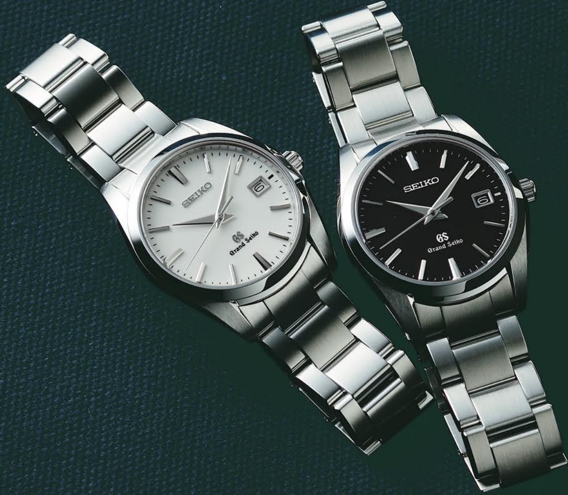
SBGX059 機種9F62 210,000円(税抜き 200,000円) ステンレスケース・バンド