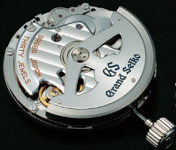
GMT機能が付加された、 自動巻スプリングドライブ キャリバー9R66。