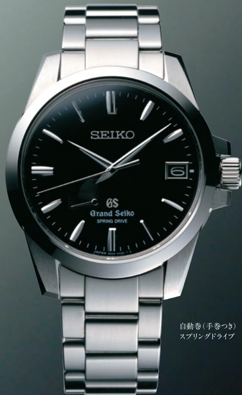
自動巻(手巻つき) スプリングドライブ