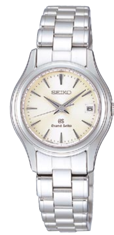
STGF025 機種4J52 252,000円(税抜き 240,000円) ステンレスケース・バンド