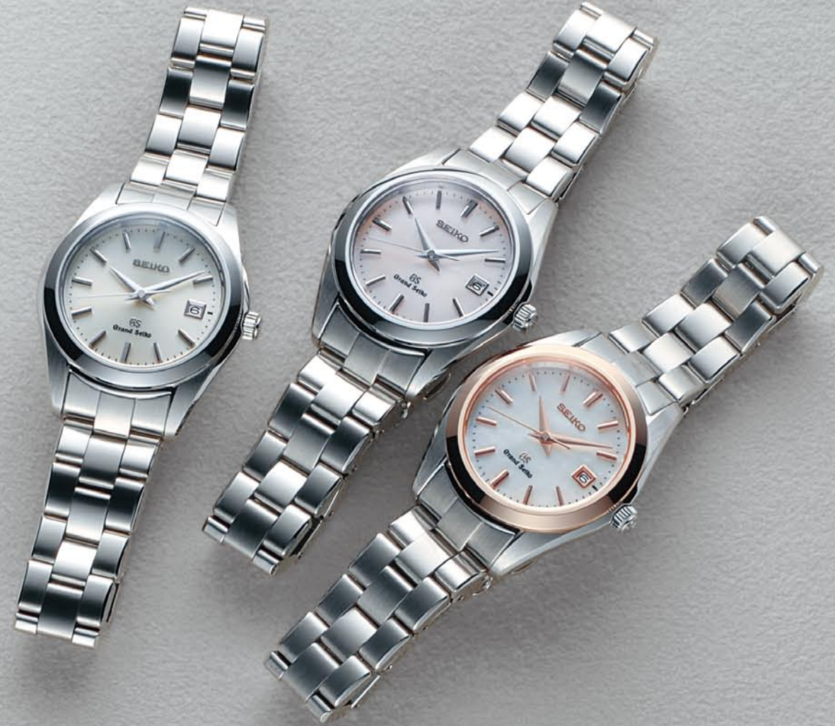
STGF065 機種4J52 210,000円(税抜き 200,000円) ステンレスケース・バンド

共通仕様 クォーツモデル 日常生活用強化防水(10気圧) 耐磁 サファイアガラス(無反射コーティング) 電池寿命約3年 精度:年差±10秒 SBGX059・061 ケースサイズ:37.0mm 重さ:134g 厚さ:10.0mm