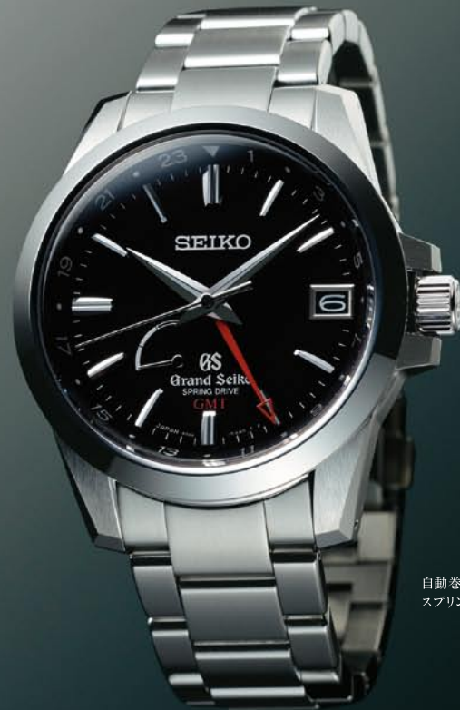
自動巻(手巻つき) スプリングドライブGMT