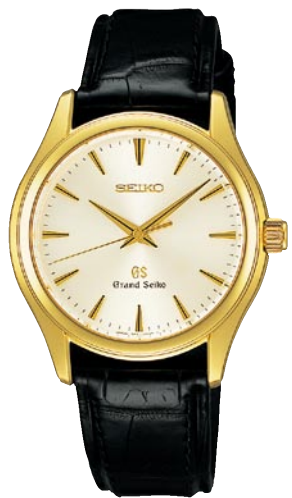
SBGX038 機種9F61 682,500円(税抜き 650,000円) 18Kイエローゴールドケース クロコダイルバンド 18Kイエローゴールドリゅうず・美錠