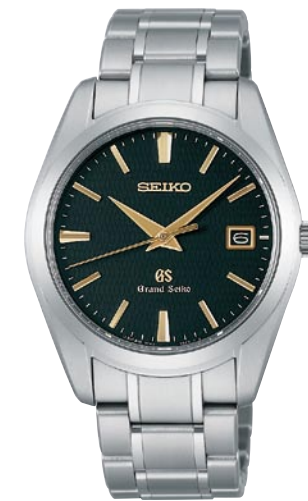
SBGX069 機種9F62 315,000円(税抜き 300,000円) ブライトチタンケース・バンド

共通仕様 クォーツモデル 日常生活用強化防水(10気圧) 耐磁 サファイアガラス(無反射コーティング) 電池寿命約3年 精度:年差±10秒 SBGT035-037 ケースサイズ:37.0mm 重さ:126g 厚さ:9.9mm SBGT038 ケースサイズ:37.0mm 重さ:132g 厚さ:9.9mm SBGX063-065 ケースサイズ:37.0mm 重さ:134g 厚さ:10.0mm SBGX067-069 ケースサイズ:37.0mm 重さ:79g 厚さ:10.0mm SBGX063は、P.20のSTGF065とペアモデルになります。