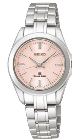
STGF045 機種4J51 189,000円(税抜き 180,000円) ステンレスケース・バンド

共通仕様 クォーツモデル 日常生活用強化防水(10気圧) 耐磁 デュアルカーブサファイアガラス(無反射コーティング) 電池寿命約3年(SBGF029は約5年) 精度:年差±10秒 SBGX002 ケースサイズ:36.5mm 重さ:122g 厚さ:11.2mm SBGX005-041 ケースサイズ:36.5mm 重さ:116g 厚さ:11.2mm SBGX009 ケースサイズ:36.5mm 重さ:50g 厚さ:10.4mm SBGF029 ケースサイズ:34.5mm 重さ:41g 厚さ:9.3mm SBGX002-005-041, SBGF029は、それぞれ、P.24のSTGF022-025-041, STGF029とペアモデルになります。 SBGX002のバンドのスマールアジャスト駒には、一部金色めっきを使用しています。 ※りゅうずを一段引いて操作することにより、時計の動きを止めずに時針のみの時刻修正が可能なので、海外旅行時等に大変便利です。