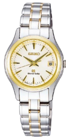
STGF022 機種4J52 451,500円(税抜き 430,000円) ステンレスケース・バンド (一部18Kイエローゴールド)