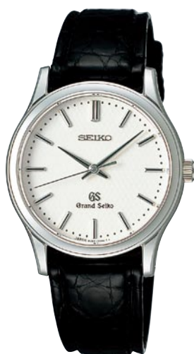
SBGF029 機種8J55 189,000円(税抜き 180,000円) ステンレスケース クロコダイルバンド 時針単独時差修正機能*