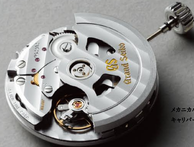
メカニカル自動巻3DAYS キャリバー9S65。

グランドセイコーの9Sメカニカルムーブメント。その開発者がめざしたのは「実用的な機械式時計」。 つまり、特別に気を使わなくても高精度を維持できる機械式時計だった。それなら、複雑な機構よりも シンプルな構造のほうが有利である。ただし、そのためにはすべての部品の加工精度を 徹底的に高める必要があった。それが実現できたのは、現代の進化した機械工学と 名人と呼ばれる職人たちの存在があったからだ。