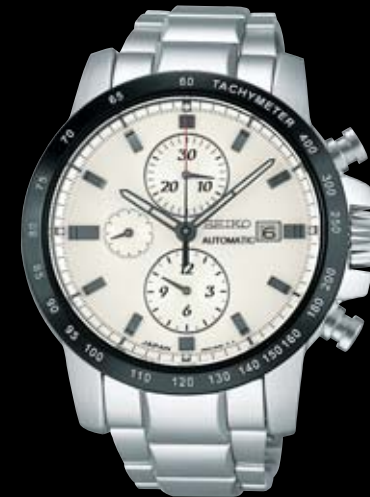
SAGH003 273,000円 (税抜き 260,000円) Cal.6S28