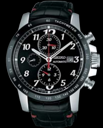
SAGH005 262,500円 (税抜き 250,000円) Cal.6S28 クロコダイルバンド