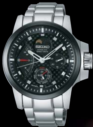
SAGG019 262,500円 (税抜き 250,000円) Cal.5D88