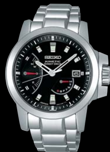
SAGG007 199,500円 (税抜き 190,000円) Cal.5D44