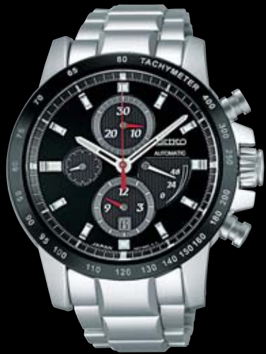
SAGH007 315,000円 (税抜き 300,000円) Cal.6S37