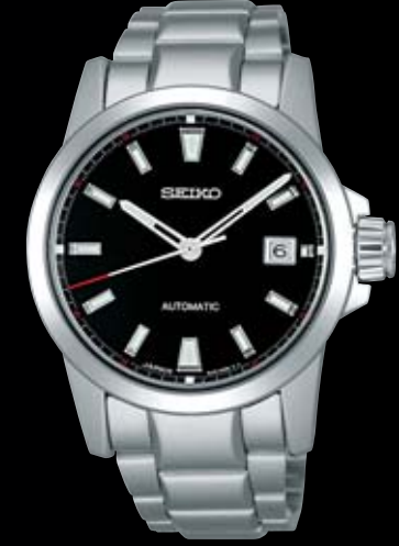
SAGQ003 199,500円 (税抜き 190,000円) Cal.8L35 5月下旬発売予定