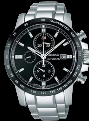
SAGH001 273,000円 (税抜き 260,000円) Cal.6S28