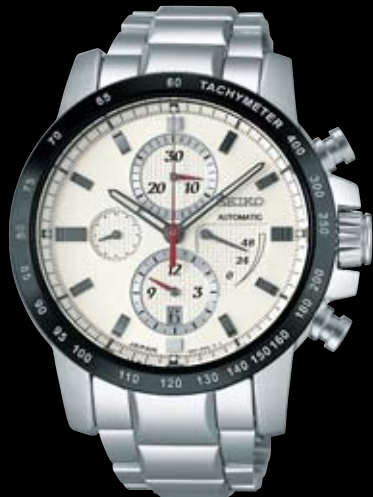
SAGH009 315,000円 (税抜き 300,000円) Cal.6S37