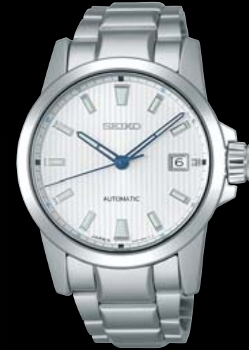
SAGQ001 199,500円 (税抜き 190,000円) Cal.8L35 5月下旬発売予定