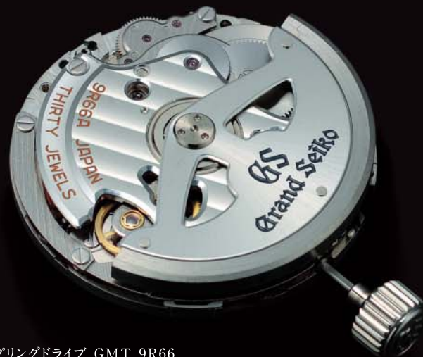
スプリングドライブ GMT 9R66