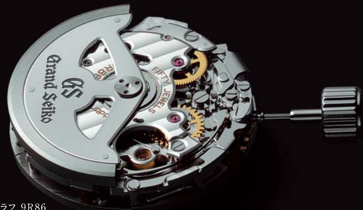
スプリングドライブ クロノグラフ 9R86