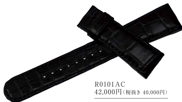
R0101AC 42,000円(税抜き 40,000円)

かん幅-中留幅 21mm-18mm 色 黒 バンド材質 クロコダイル(手縫いステッチ)