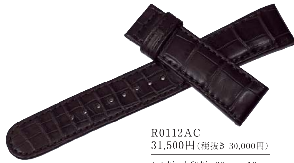
R0112AC 31,500円(税抜き 30,000円)