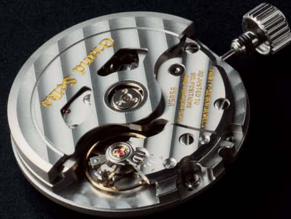
10振動のキャリバー9S85

9Sムーブメントこそ、真のマニファクチュールにしかつけないメカニカルムーブメントであると自負しています。