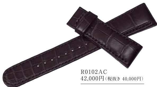
R0102AC 42,000円(税抜き 40,000円)

かん幅-中留幅 21mm-18mm 色 黒 バンド材質 クロコダイル(手縫いステッチ)