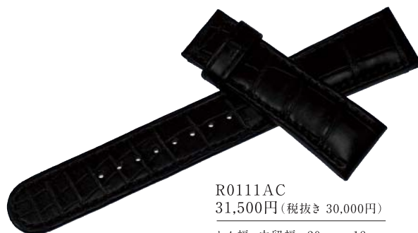
R0111AC 31,500円(税抜き 30,000円)

かん幅-中留幅 21mm-18mm 色 こげ茶 バンド材質 クロコダイル(手縫いステッチ)