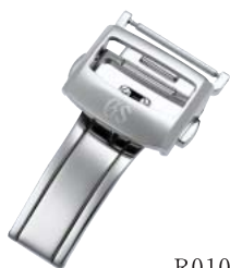
R0101AC-BK00 52,500円(税抜き 50,000円)