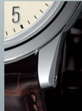
グランドセイコー メカニカルハイビート36000 クラシック

かつてセイコーを代表した「クラウン」、「クロノス」。これらの機種で培われた技術が、やがて「グランドセイコー」に結実することになります。その先輩たちへのオマージュとして生まれたこのグランドセイコーは、先行機種に共通していたデザイン要素である柔らかな色彩の文字板と視認性の高いアラビア数字を採用。どこかなつかしさを感じさせながら、機械式高性能ムーブメントで確かな時を刻み続けます。