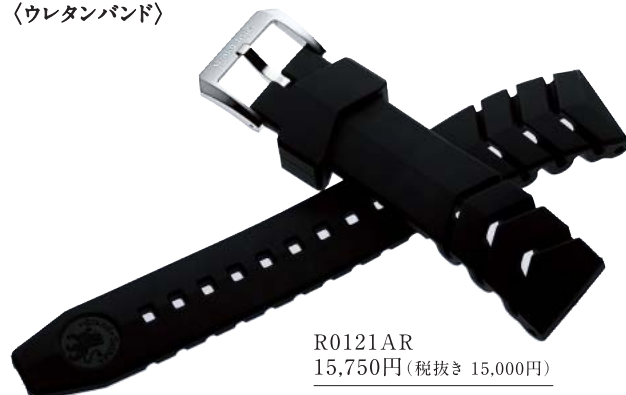
R0121AR 15,750円(税抜き 15,000円)

かん幅-美錠幅 22mm-20mm 色 黒 バンド材質 ウレタン 美錠材質 ステンレススチール