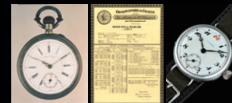
1895年「タイムキーパー」

現在、セイコーは機械式時計の最も重要なパーツといえる「ぜんまい」に至るまで、主要な部品を自社生産できる世界でも数少ない時計ブランドである。 セイコーが真のマニュファクチュールと呼ばれるまでに至ったのは、1895年に初めての機械式懐中時計「タイムキーパー」を、1913年には国産初の機械式腕時計「ローレル」を発売して以来、たゆみない技術革新を続けているからである。