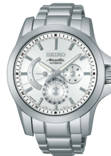
SAEC009 Cal.6R21 189,000円 (税抜き180,000円)

先進を黙したまま語る、精悍さ。 機能美を超えたデザインが、アナンタらしさを香らせる。