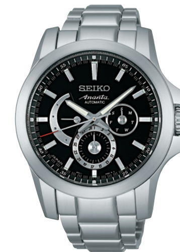
SAEC011 Cal.6R21 189,000円 (税抜き180,000円)