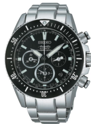
SAEK013 Cal.8R39 315,000円（税抜き300,000円）

ダイバーズウォッチには、防水性だけでなく、耐衝撃性、耐磁性などにおいて通常のウォッチよりはるかに高い水準が求められる。過酷な使用環境に耐えうるため、ムーブメントの強度検討を新たにおこない、ダイバーズ仕様のメカニカルクロノグラフムーブメント「Cal.8R39」が開発された。200m空気潜水用防水の規格に基づき耐衝撃性などの性能を向上させるため、調速機構の主要部品であるひげぜんまいに、耐衝撃性と耐磁性に優れた独自開発の素材「SPRON610」を採用。また、部品の厚みや固定方法を見直し、ムーブメントの堅牢性を高めるように設計変更している。当然ながら、ダイバーズ仕様としての堅牢性は、ムーブメント単体のみならず外装も含めた完成体として向上しているのは言うまでもない。ムーブメントの設計から主要部品の製造、組立までを全ておこなうマニファクチュールとしての技術力と、1965年に国産初のダイバーズウォッチを発売して以来、プロダイバーから高い信頼を得てきたプライドによって、セイコー初のメカニカルクロノグラフダイバーズウォッチが誕生したのである。