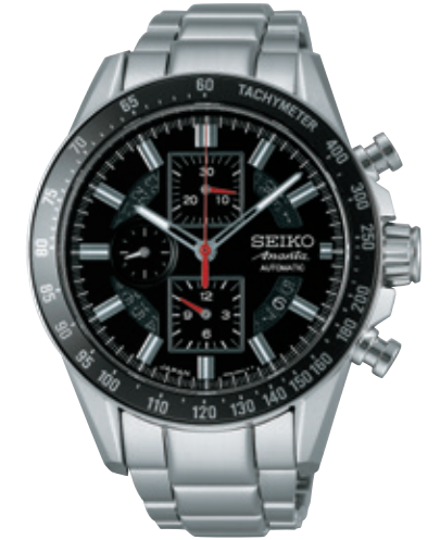
SAEH009 Cal.6S28 315,000円 (税抜き 300,000円)