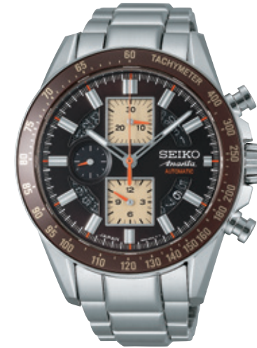
SAEH007 Cal.6S28 315,000円 (税抜き 300,000円)