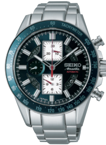
SAEH005 Cal.6S28 315,000円 (税抜き 300,000円)

モダンに昇華されたスポーティデザイン。 セイコーが誇る機械式ムーブメントを搭載し、さらなる進化を遂げる。