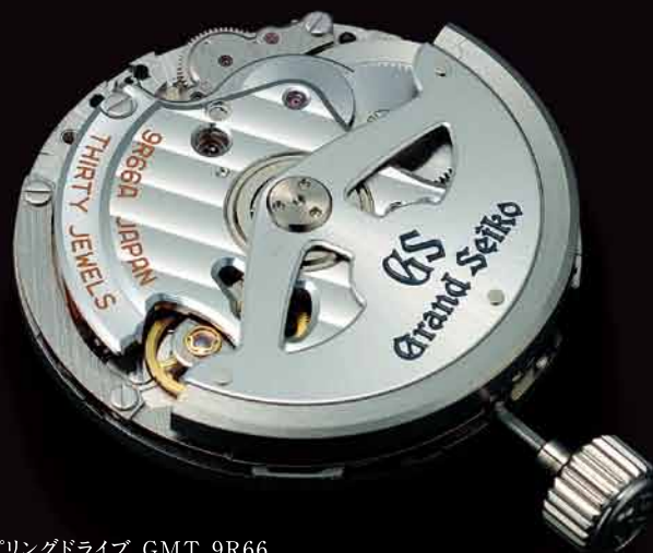
スプリングドライブ GMT 9R66