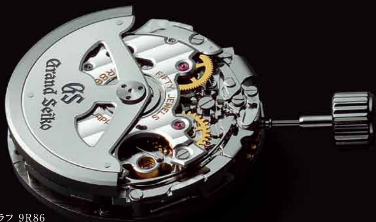
スプリングドライブ クロノグラフ 9R86