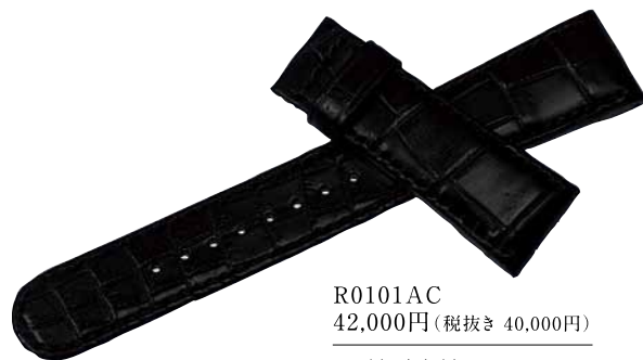
R0101AC 42,000円(税抜き 40,000円)

かん幅-中留幅 21mm-18mm 色 黒 バンド材質 クロコダイル(手縫いステッチ)