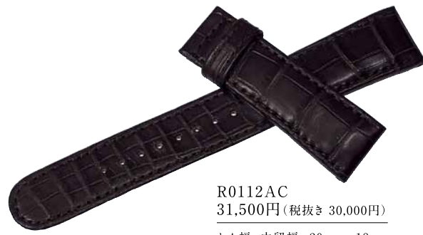
R0112AC 31,500円(税抜き 30,000円)