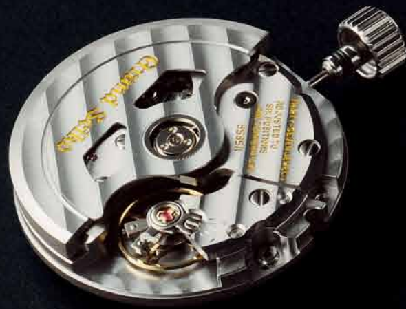
10振動のキャリバー9S85

9Sムーブメントこそ、 真のマニファクチュールにしかつけない メカニカルムーブメントであると自負しています。