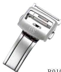
R0101AC-BK00 52,500円(税抜き 50,000円)