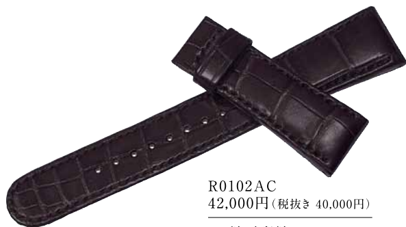
R0102AC 42,000円(税抜き 40,000円)

かん幅-中留幅 21mm-18mm 色 黒 バンド材質 クロコダイル(手縫いステッチ)