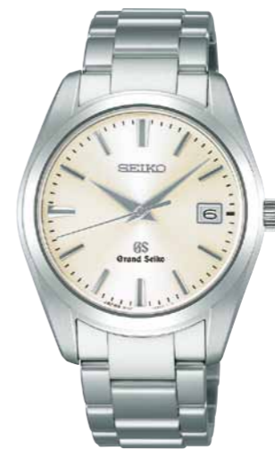
SBGX063 機種9F62 210,000円(税抜き 200,000円) ステンレスケース・バンド