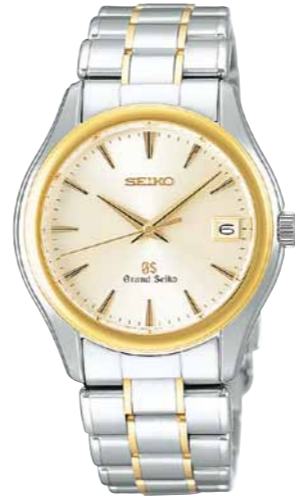
SBGX002 機種9F62 577,500円(税抜き 550,000円) ステンレスケース・バンド (一部18Kイエローゴールド)