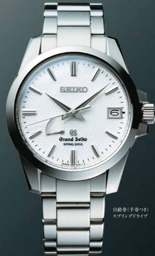
自動巻(手巻つき) スプリングドライブ