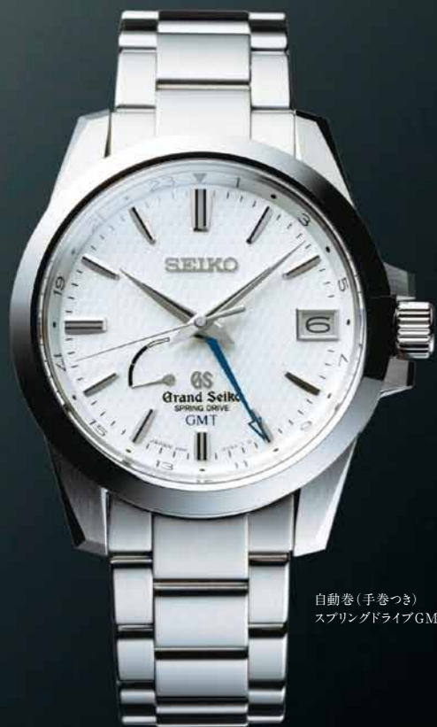
自動巻(手巻つき) スプリングドライブGMT