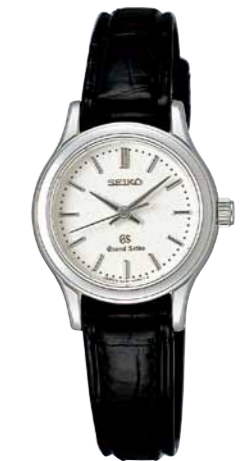
STGF029 機種4J51 189,000円(税抜き 180,000円) ステンレスケース クロコダイルバンド

共通仕様 クォーツモデル 日常生活用強化防水(10気圧) 耐磁 デュアルカーブサファイアガラス(内面無反射コーティング) 電池寿命約3年 精度:年差±10秒 STGF073 ケースサイズ:28.9mm 重さ:71g 厚さ:8.7mm STGF074 ケースサイズ:28.9mm 重さ:73g 厚さ:8.7mm STGF022 ケースサイズ:27.0mm 重さ:72g 厚さ:9.2mm STGF025-041 ケースサイズ:27.0mm 重さ:68g 厚さ:9.2mm STGF029 ケースサイズ:25.5mm 重さ:22g 厚さ:8.2mm STGF022のバンドのスマールアジャスト駒には、一部金色めっきを使用しています。STGF022-025-041、STGF029は、それぞれP.22のSBGX002-005-041、SBGF029とペアモデルになります。