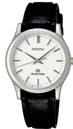
SBGF029 機種8J55 189,000円(税抜き 180,000円) ステンレスケース クロコダイルバンド 時針単独時差修正機能*