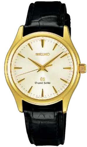
SBGX038 機種9F61 735,000円(税抜き 700,000円) 18Kイエローゴールドケース クロコダイルバンド 18Kイエローゴールドリゅうず・美錠