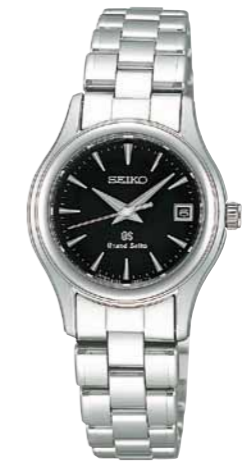
STGF041 機種4J52 252,000円(税抜き 240,000円) ステンレスケース・バンド