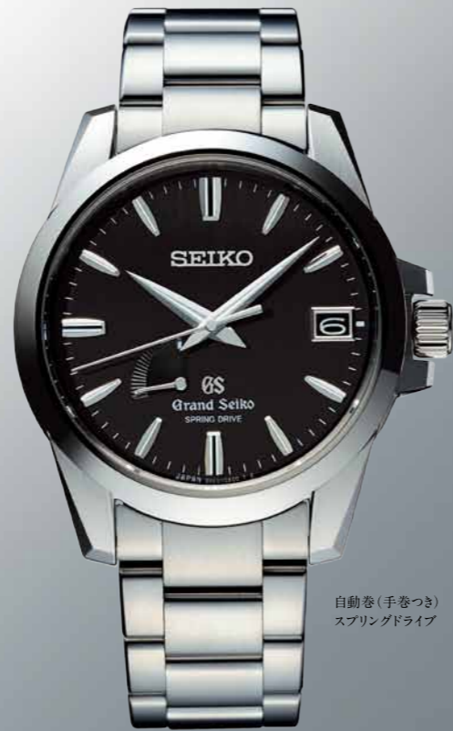
自動巻(手巻つき) スプリングドライブ