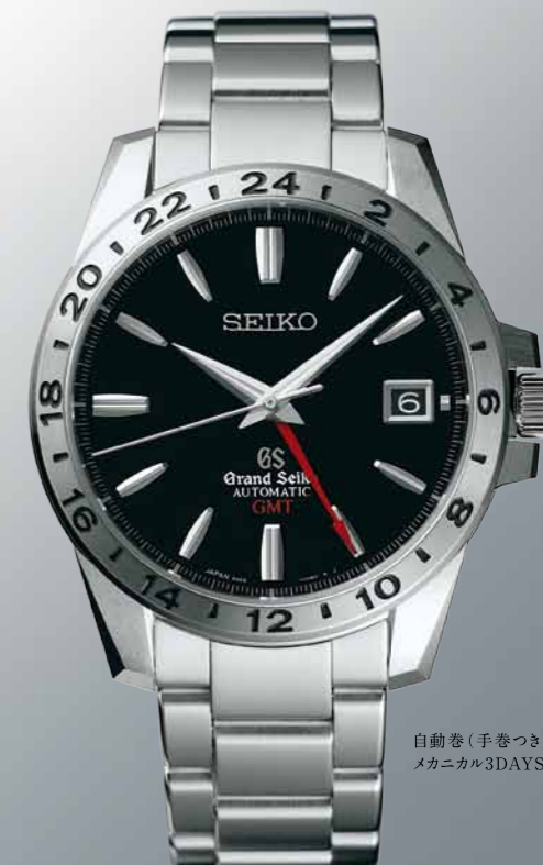
自動巻(手巻つき) メカニカル3DAYS GMT

SBGM025 機種9S66 472,500円(税抜き 450,000円) ステンレスケース・バンド 24時針つき(GMT*1表示可能)