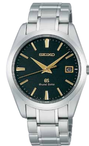
SBGX069 機種9F62 315,000円(税抜き 300,000円) ブライトチタンケース・バンド