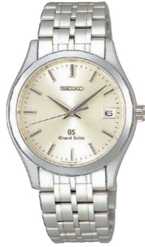
SBGX019 機種9F62 2,887,500円(税抜き 2,750,000円) 18Kホワイトゴールドケース 18Kホワイトゴールドリゅうず・バンド