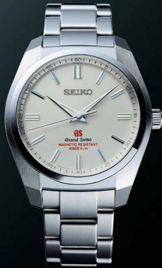
SBGX091 機種9F61 315,000円(税抜き 300,000円) ステンレスケース・バンド