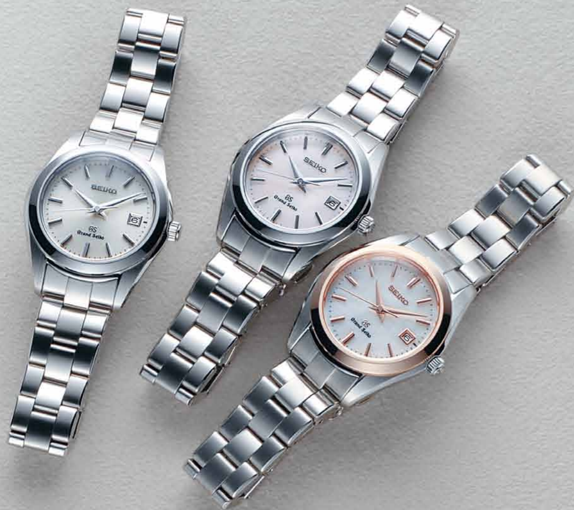
STGF065 機種4J52 210,000円(税抜き 200,000円) ステンレスケース・バンド