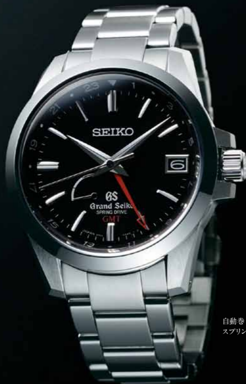
自動巻(手巻つき) スプリングドライブGMT

SBGE009 機種9R66 577,500円(税抜き 550,000円) ステンレスケース・バンド 24時針つき(GMT*表示可能)