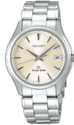
SBGX005 機種9F62 252,000円(税抜き 240,000円) ステンレスケース・バンド