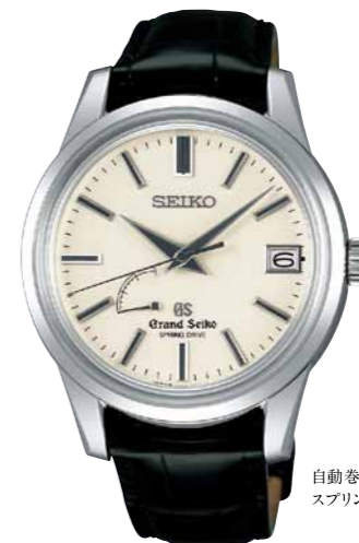
自動巻(手巻つき) スプリングドライブ