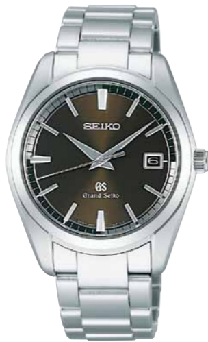
SBGX073 機種9F62 210,000円(税抜き 200,000円) ステンレスケース・バンド