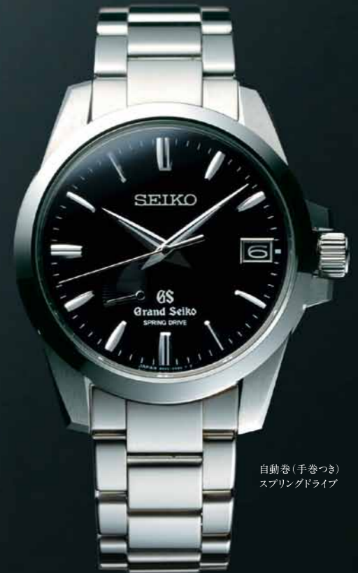
自動巻(手巻つき) スプリングドライブ

SBGA079 機種9R65 630,000円(税抜き 600,000円) ブライチタンケース・バンド