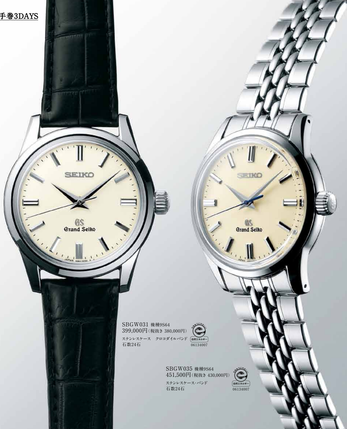
SBGW031 機種9S64 399,000円(税抜き 380,000円) ステンレスケース クロコダイルバンド 石数24石