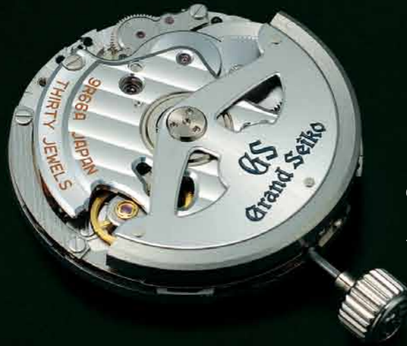
GMT機能が付加された、 自動巻スプリングドライブ キャリバー9R66。