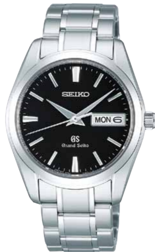
SBGT037 機種9F83 241,500円(税抜き 230,000円) ステンレスケース・バンド