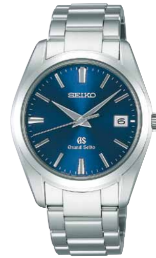
SBGX065 機種9F62 210,000円(税抜き 200,000円) ステンレスケース・バンド