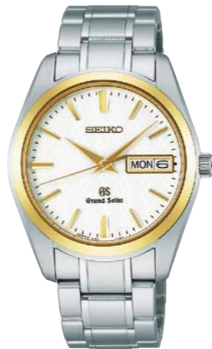
SBGT038 機種9F83 346,500円(税抜き 330,000円) ステンレスケース・バンド (一部18Kイエローゴールド)