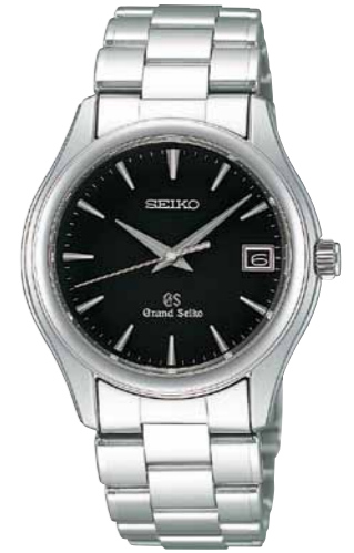
SBGX041 機種9F62 252,000円(税抜き 240,000円) ステンレスケース・バンド