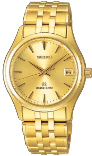
SBGX018 機種9F62 2,782,500円(税抜き 2,650,000円) 18Kイエローゴールドケース 18Kイエローゴールドリゅうず・バンド