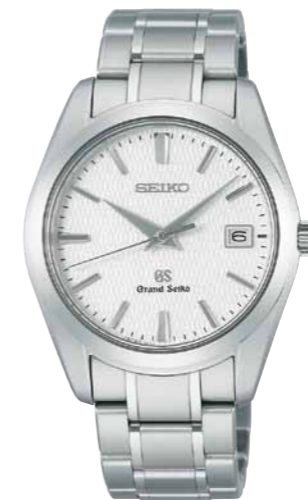
SBGX067 機種9F62 315,000円(税抜き 300,000円) ブライトチタンケース・バンド