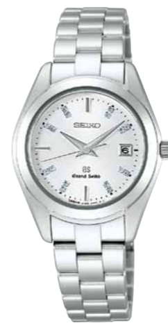
STGF073 機種4J52 262,500円(税抜き 250,000円) ステンレスケース・バンド

共通仕様 クォーツモデル 日常生活用強化防水(10気圧) 耐磁 デュアルカーブサファイアガラス(内面無反射コーティング) 電池寿命約3年 精度:年差±10秒 STGF065-067 ケースサイズ:28.9mm 重さ:71g 厚さ:8.7mm STGF068 ケースサイズ:28.9mm 重さ:73g 厚さ:8.7mm STGF065は、P.20のSBGX063とペアモデルになります。