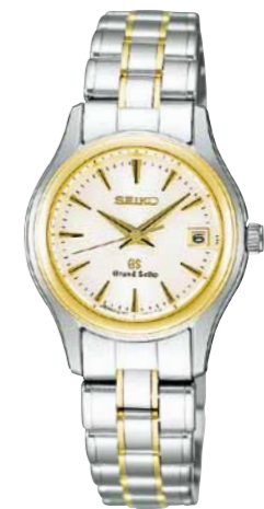
STGF022 機種4J52 483,000円(税抜き 460,000円) ステンレスケース・バンド (一部18Kイエローゴールド)