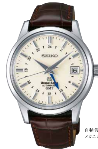
自動巻(手巻つき) メカニカル3DAYS GMT