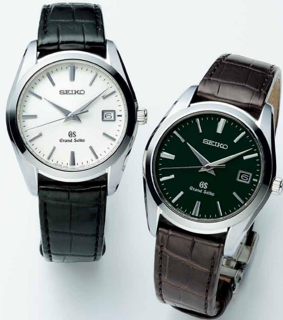
SBGX095 機種9F62 210,000円(税抜き 200,000円) ステンレスケース クロコダイルバンド