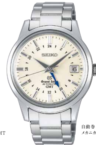
自動巻(手巻つき) メカニカル3DAYS GMT