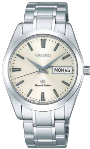
SBGT035 機種9F83 241,500円(税抜き 230,000円) ステンレスケース・バンド