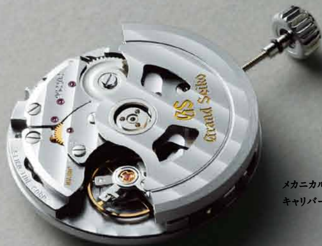
メカニカル自動巻3DAYS キャリバー9S65。

グランドセイコーの9Sメカニカルムーブメント。その開発者がめざしたのは「実用的な機械式時計」。 つまり、特別に気を使わなくても高精度を維持できる機械式時計だった。それなら、複雑な機構よりも シンプルな構造のほうが有利である。ただし、そのためにはすべての部品の加工精度を 徹底的に高める必要があった。それが実現できたのは、現代の進化した機械工学と 名人と呼ばれる職人たちの存在があったからだ。