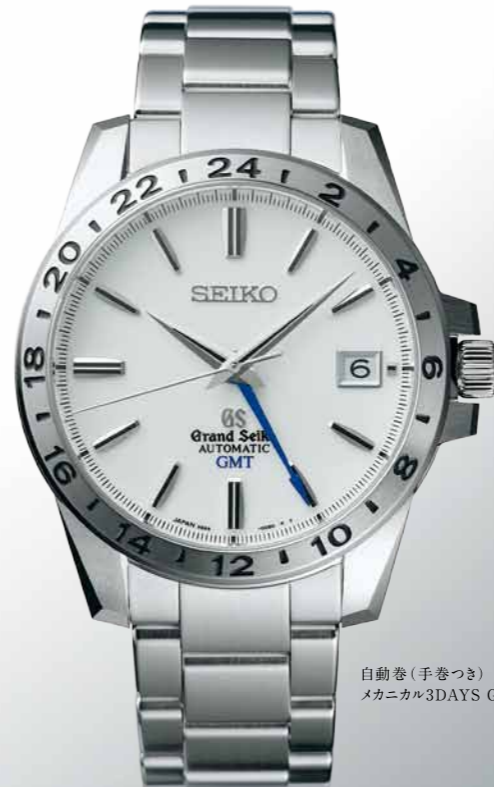
自動巻(手巻つき) メカニカル3DAYS GMT