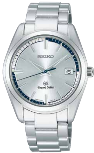
SBGX071 機種9F62 210,000円(税抜き 200,000円) ステンレスケース・バンド