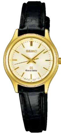
STGF038 機種4J51 546,000円(税抜き 520,000円) 18Kイエローゴールドケース クロコダイルバンド 18Kイエローゴールドリゅうず・美錠

共通仕様 クオーツモデル 日常生活用強化防水(10気圧)(SBGX038・STGF038は日常生活用防水) 耐磁 デュアルカーブサファイアガラス(内面無反射コーティング)(SBGX019はサファイアガラス(内面無反射コーティング)) 電池寿命約3年 精度:年差±10秒 SBGX018 ケースサイズ:35.5mm 重さ:166g 厚さ:11.3mm SBGX019 ケースサイズ:35.7mm 重さ:172g 厚さ:9.9mm SBGX038 ケースサイズ:35.5mm 重さ:67g 厚さ:10.0mm STGF038 ケースサイズ:26.4mm 重さ:32g 厚さ:7.6mm SBGX019は、18Kホワイトゴールドの素材の上に、より美しい銀色に仕上げるためにロジウムめっきを施しています。