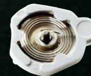
バックラッシュ・オートアジャスト機構を司るひげぜんまい入りの制動車

歯車は「遊び」がなければ回転できない。しかしその「遊び」が秒針の震えの原因になる。この震えを押さえる機構は従来からあったが、その効果にグランドセイコーの開発者たちは満足しなかった。そして「バックラッシュ・オートアジャスト機構」という新しい方式が開発された。秒針の的確で美しい動きを実現したこの機構には、機械式時計の心臓部を構成するひげぜんまいが使われている。