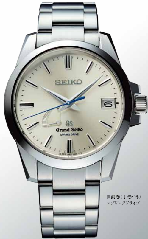
自動巻(手巻つき) スプリングドライブ