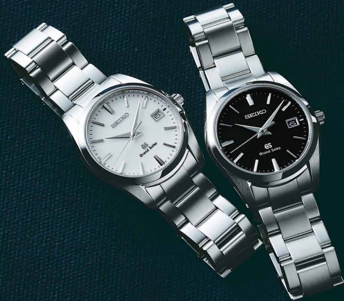
SBGX059 機種9F62 210,000円(税抜き 200,000円) ステンレスケース・バンド