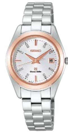
STGF074 機種4J52 325,500円(税抜き 310,000円) ステンレスケース・バンド (一部18Kピンクゴールド)