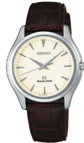
SBGX009 機種9F61 189,000円(税抜き 180,000円) ステンレスケース クロコダイルバンド