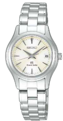
STGF025 機種4J52 252,000円(税抜き 240,000円) ステンレスケース・バンド